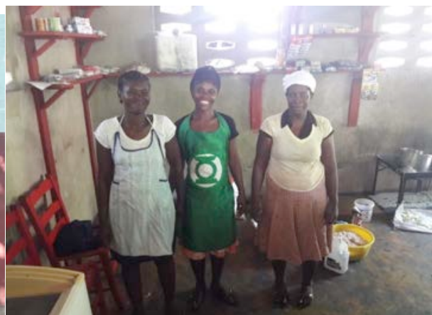
Die drei stolzen Köchinnen