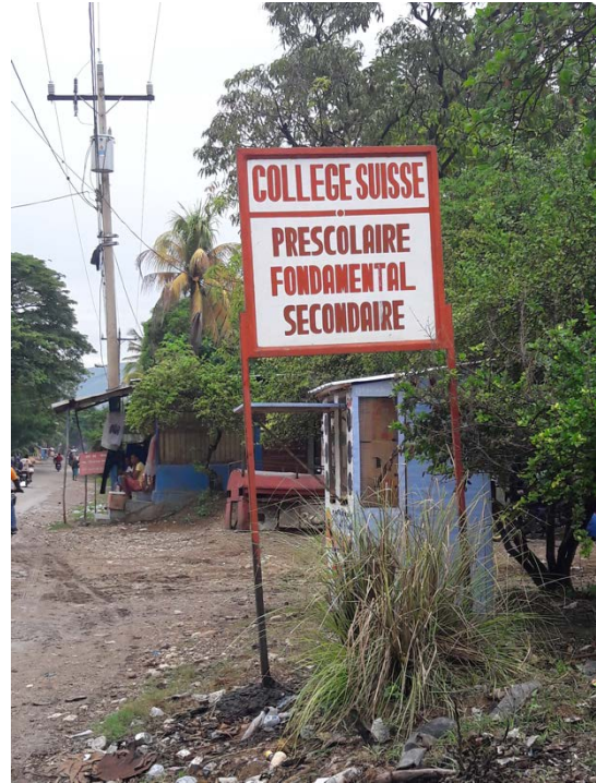
Wegweiser auf der Hauptstrasse nach Jacmel