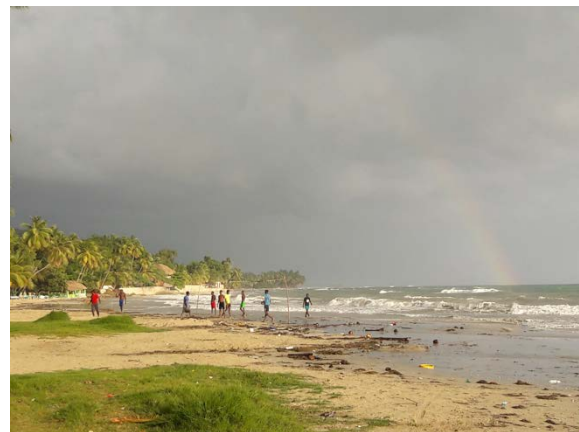
Strand von «Ti-Mouillage»