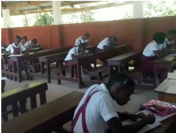
Während den Prüfungen

folgt aufgeteilt: 7ième, 8ième, 9ième, secondaire I, II, III und IV, was unserer Oberstufe 7.-9. Klasse (und damit Abschluss obligatorische Schulzeit) und unserer Gymnasialstufe entspricht – in Haiti ist sie allerdings ein Jahr länger. Es wurde mir auch bewusst, wie anspruchsvoll es ist, einen Stundenplan zusammenzustellen, da es pro Fach einen Lehrer gibt und praktisch alle Lehrer noch an 3-4 anderen Schulen unterrichten. So kommen sie für ihr Fach und «düsen» nach dem Unterricht sofort weiter. Das Konzept einer Klassenlehrerin sowie einer 50-100%igen Anstellung gibt es hier wohl nicht.