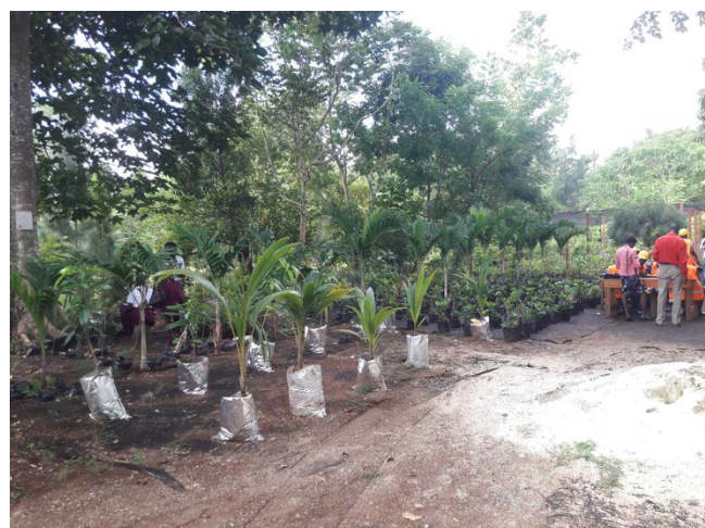
Schulgarten, wo ein mehrtägiger Workshop einer haitianischen NGO, die von einer belgischen NGO unterstützt wurde, stattfand.