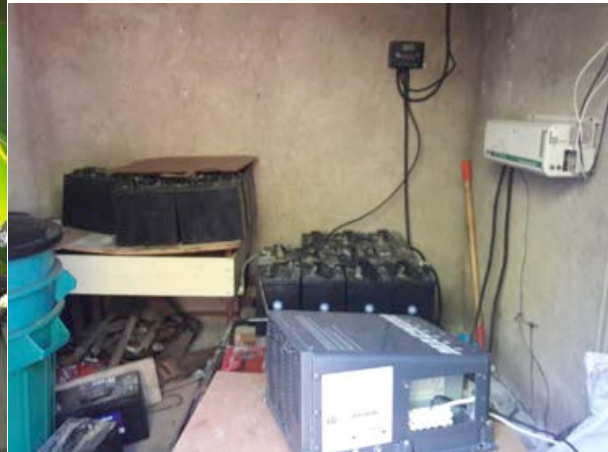
Batterien und Inverter (Umwandler)