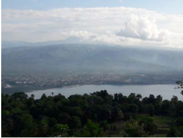
Sicht auf Jacmel

Am Freitag, 29. Oktober, nahm Verbo Jean-Julien mich auf einen Ausflug nach Lamontagne mit, wo er aufgewachsen war und wo er eine Schule am Aufbau ist. Die Fahrt dauerte ca. 1h und sie brachte eine unwahrscheinlich schöne – für mich erstmalige – Sicht auf Jacmel mit sich.