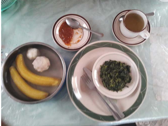
«Zmorge» (Kochbananen mit Manjok, Guavemus, Spinat, Guavetee)