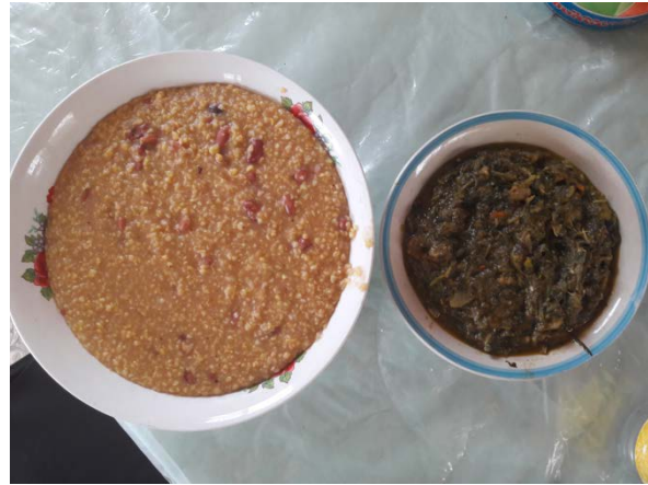
Reis mit Bohnen und Spinat/Fleischsauce