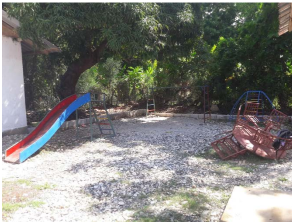
Spielplatz, rechts vom Primarschulgebäude