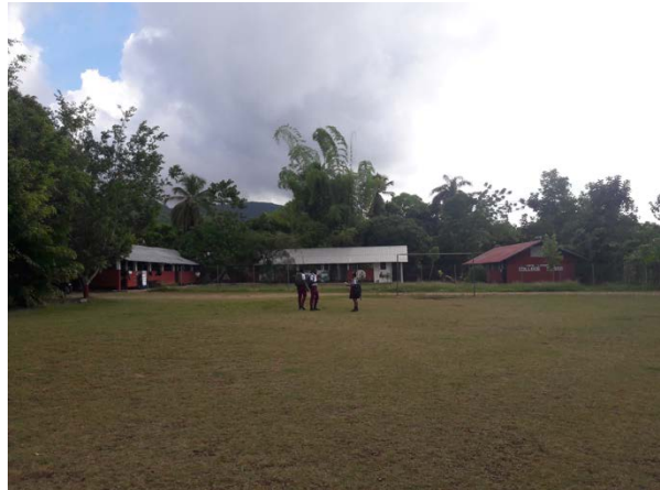
Blick zur Primarschule (Gebäude Mitte und rechts)

Es nimmt mir jedes Mal den Atem, wenn ich auf das Gelände des Collège Suisse komme. Mit seinen 12'900 m 2 (12,9 ha) ist es eine ungemein grosse Fläche. In der Mitte befindet sich ein grosser freier Platz, um Fussball zu spielen oder andere Sportarten auszuführen (wäre ein idealer Ort für einen Sportplatz). Südlich die drei Gebäude für die Sekundarschule (Collège Suisse am Morgen, Marie Reine des Apôtres am Nachmittag), westlich das Gebäude für den Multimediasaal und die Bibliothek, nördlich ein leerer «Platz», wo früher ein notdürftiger Hangar stand, dann das Verwaltungsgebäude mit einem kleinen Büro für das Collège Suisse (links) und für Abochem (rechts) und östlich drei Gebäude, wo das linke für die Sekundarschule ist, das mittlere für die Primarschule (Kindergarten – 3. Klasse) und das rechte schon bereitsteht für die 4.-6. Klasse. Ein Situationsplan könnte diese verbale Abhandlung perfekt ersetzen – die Erstellung eines solchen ist auch etwas, was wir als einer der Prioritäten festgelegt haben. Eine Idee wäre, über freiwillige Zeichner in der Schweiz solch einen Einsatz vorzubereiten oder ihn in Haiti in Auftrag zu geben (ca. USD 2'000).