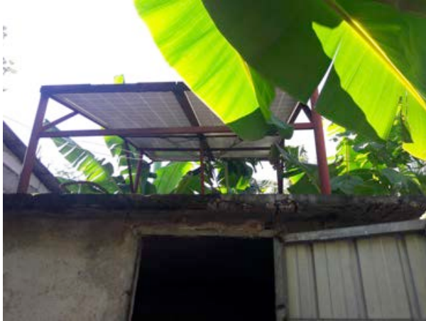
Die Ende 2015 installierten Solarpanels