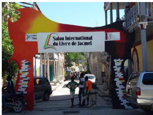
«Eingang» zu den Bücherständen (vor Hotel Florita)

Just während meiner Anwesenheit fand vom 29.-31. Oktober der «Salon International du Livre de Jacmel» statt, der am Abend des 29. Oktober im Rathaus mit einem Rahmenprogramm eröffnet wurde. Anwesend waren auch viele haitianische Schriftsteller, welche in den Folgetagen beim Bücherverkauf signierten. Ich war sehr froh, dass Verbo mich dahinführte. In Haiti gibt es wenig Möglichkeiten Bücher zu kaufen und sie sind auch sehr teuer. So nützte ich die Gelegenheit und kaufte Bücher (Landkarten, Staatskundebücher, Comics) für die Oberstufe und Erzähl- und Lehrbücher für die Primarschule.