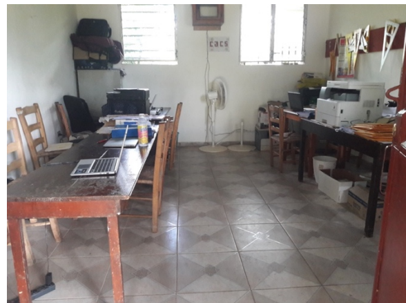
Einziges, enges Büro des Collège Suisse