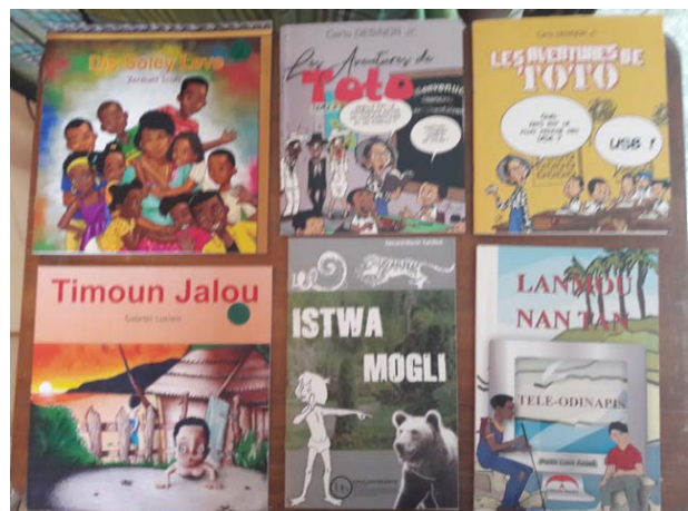
Fürs Collège Suisse gekaufte Bücher