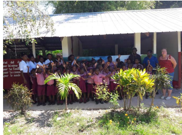
Vor dem Primarschulgebäude

Am Freitag, 2. November ging ich nochmals bei der Schule vorbei und wurde auf Aktivitäten im «Audiosaal» aufmerksam. Auf meine Nachfrage wurde mir gesagt, dass eine Weiterbildung für die Primarlehrerinnen stattfindet. Die Organisation «Haiti Futur» ( www.haitifutur.com ) hatte das Collège Suisse (unter anderen Primarschulen) für eine interaktive Lernsoftware ausgewählt, wo die Ergebnisse an der Wand berührt werden können und die Software darauf reagiert. Ich war begeistert – so etwas hatte ich noch nie gesehen. Die Schule darf diese Software behalten und künftig ihre Primarschüler so schulen!