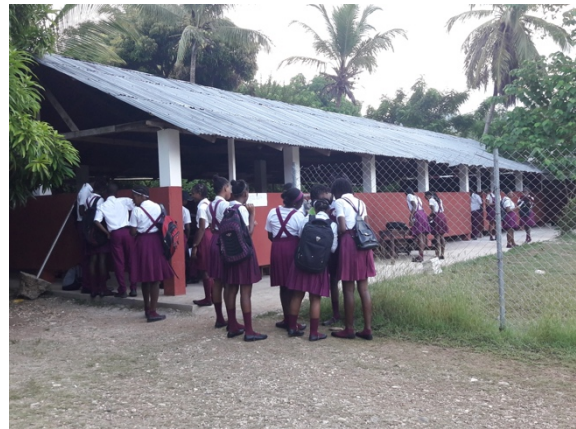
Zwischen oder vor den Prüfungen