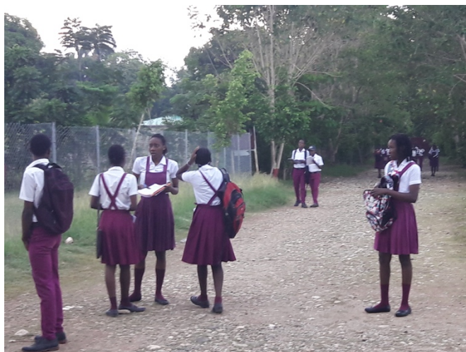
Schüler des Collège Suisse die Einfahrt heraufkommend

chronologisch, sondern themenbezogen aufgebaut.