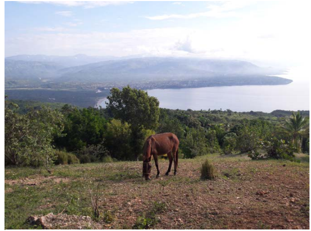
Sicht auf Jacmel und Richtung Dominikanische Republik