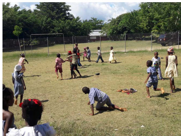
Spielrasen, durch Haag vom Oberstufenteil abgegrenzt