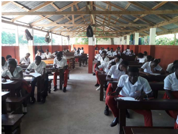
Schüler von «Marie Reine des Apôtres» während den Prüfungen