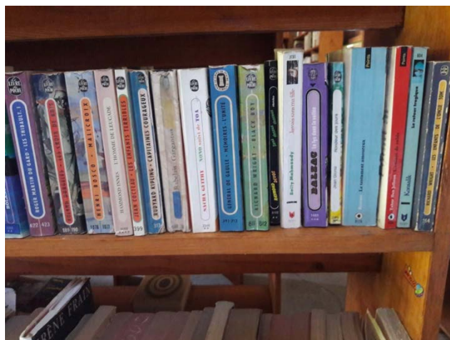
Auswahl von Büchern, keine Kategorisierung erkennbar