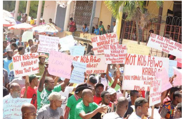
Demonstrationen in den Strassen von Port-au-Prince

Mitte Oktober demonstrierten erneut über 100'000 Haitianer, da unter der Regierung Martelly über 3,8 Milliarden US-Dollar aus dem Petrocaribe-Fonds veruntreut worden seien. Petrocaribe ist ein 2005 von der venezolanischen Regierung unter Hugo Chávez geschaffenes Hilfsprogramm, mit dem den Ländern der Karibik Erdöl zu subventionierten Preisen angeboten wird. Die von Haiti dank Petrocaribe erzielten Ressourcen sollten in Bauvorhaben in der Infrastruktur sowie in Wirtschafts- und Sozialprojekte investiert werden. 1