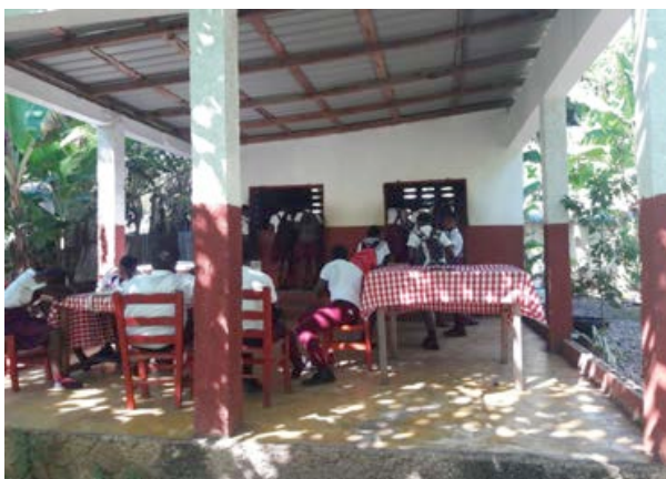
Die «petit bar» wird rege benutzt

Dieses kleine Restaurant – sie nennen es «petit bar» wurde 2016 gebaut, finanziert von einer Privatperson, welche auch den Betrieb regelt. Es ist von 6.30 Uhr morgens bis abends geöffnet, sodass alle Schüler die Möglichkeit zur Verpflegung haben. Angeboten werden warme Sandwiches, «patées» (Teigtaschen mit Inhalt), Getränke und Süßigkeiten zu einem reduzierten Preis. Schüler, Lehrer und Besucher sind sehr froh über diese Möglichkeit, denn früher gab es nur die Möglichkeit, von einzelnen Marktfrauen Getränke und Essen zu kaufen. So wurde dieser Ort während meines Aufenthaltes auch dazu benutzt, eine Gruppe, welche eine Lernwoche im Schulgarten absolvierte, zu verköstigen. Gekocht wird – leider noch– mit offenem Holzkohlefeuer.